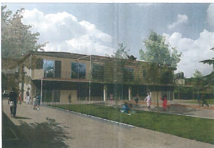
Ce nouvel ensemble sera opérationnel au début de l'été 2010.

Ce jardin d'enfants est en cours d'aménagement dans les anciens logements des instituteurs : l'espace créé par l'ensemble groupe scolaire / CLAE / jardin d'enfants, entièrement clos, et à proximité immédiate du stade municipal, sera relié à la place du Château par le nouveau Carrelet des Remparts, et accessible facilement depuis le Carrelet des Ecoles, puisque les escaliers ont été supprimés.