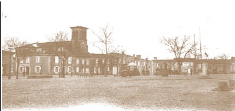
SEISSAN — Place Carnot et Clocher

e-mail : espace.astarac.seissan@orange.fr